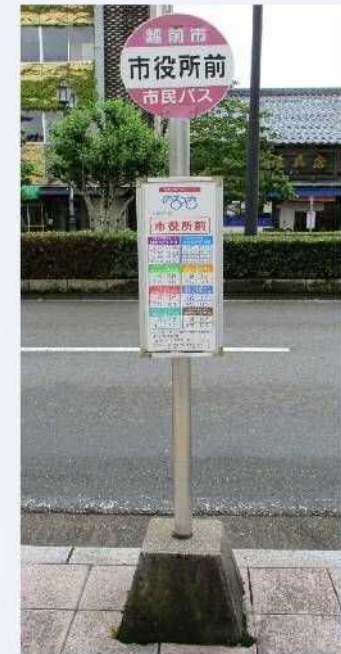
Ponto de ônibus Norossa